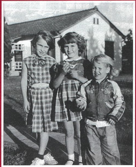
▲ 現在の航空自衛隊岐阜基地は朝鮮戦争当時、前線への補給基地「キャンプ岐阜」として米兵とその家族、数千人が滞在していた。(那加官有地無番地・昭和20年代)

▶ ダイハツのオート三輪に乗って商売に。(鶴沼羽場町・昭和30年頃)