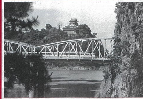
▲ 犬山城と犬山橋を渡る名鉄「たかやま号」。(各務原市～犬山市・昭和44年)